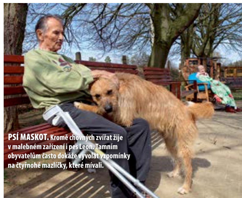
PSÍ MASKOT. Kromě chovných zvířat žije v malebném zařízení i pes Leon. Tamním obyvatelům často dokáže vyvolat vzpomínky na čtyřnohé mazlíčky, které mívali.