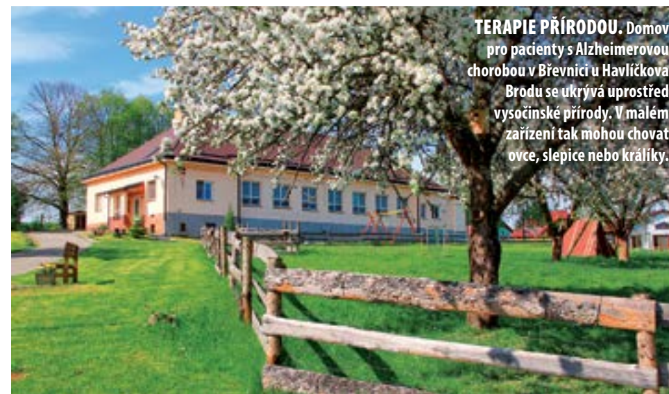
TERAPIE PŘÍRODOU. Domov pro pacienty s Alzheimerovou chorobou v Břevnici u Havlíčkova Brodu se ukrývá uprostřed vysočinské přírody. V malém zařízení tak mohou chovat ovce, slepice nebo králíky.

Text: Radka Římanová