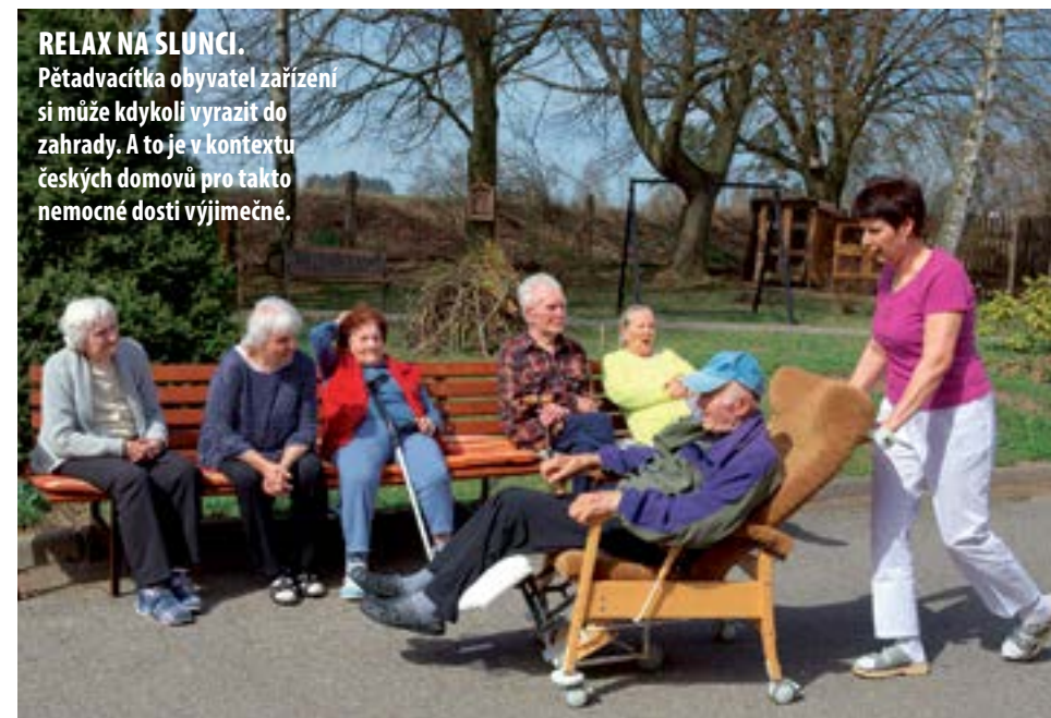
RELAX NA SLUNCI. Pětadvacítka obyvatel zařízení si může kdykoli vyrazit do zahrady. A to je v kontextu českých domovů pro takto nemocné dosti výjimečné.