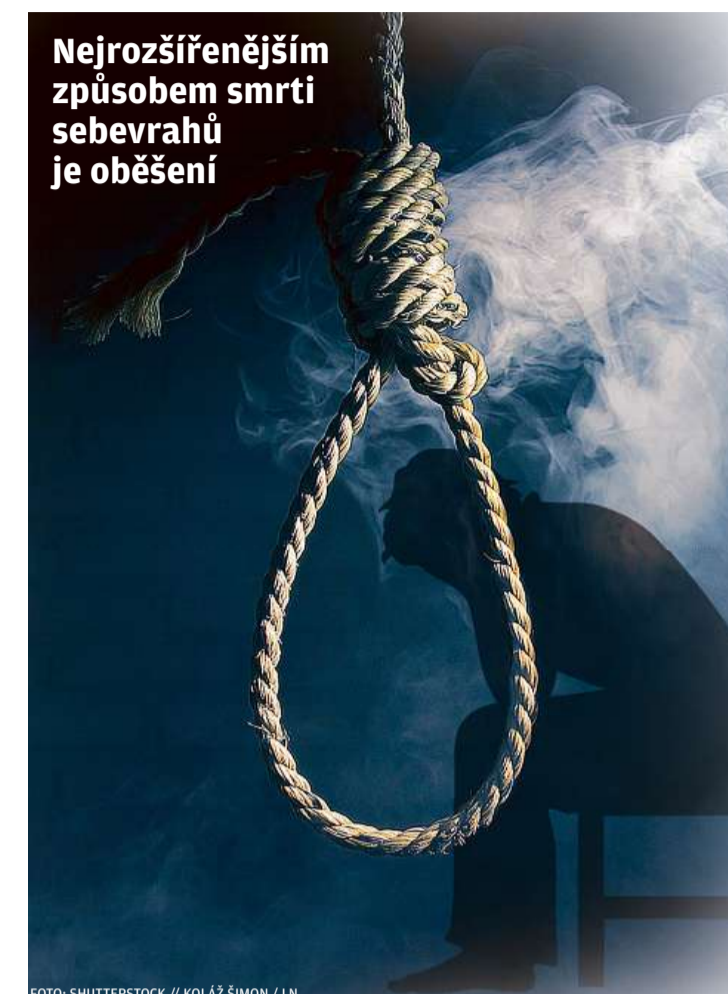
Nejrozšířenějším způsobem smrti sebevražd je oběšení

U mladších dětí jde o výjimečné případy. Jeden, který se stal před čtyřmi lety, pomohl vzniku preventivního programu. Sebevraždu spáchala teprve třináctiletá dívka, kterou šikanovali spolu-