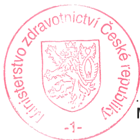
..... MUDr. Svatopluk Němeček, MBA ministr zdravotnictví